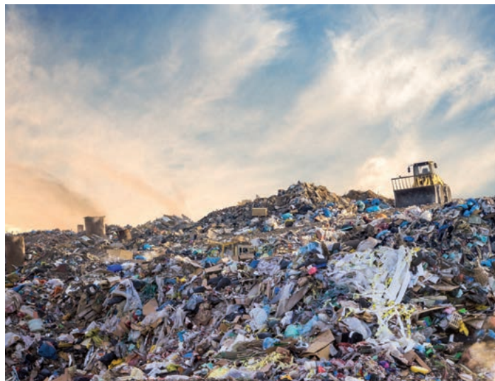
Nach Stilllegung zu tragende Aufwendungen rückstellungsfähig?