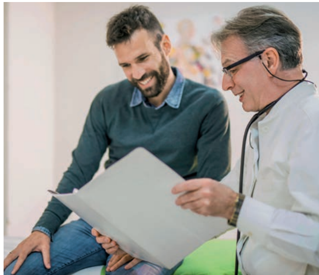
Arztbesuche müssen sein, aber ist das Arbeitszeit?

Das BAG sieht dabei den Grundsatz der freien Arztwahl und verlangt von Arbeitnehmern nicht, zu einem Arzt