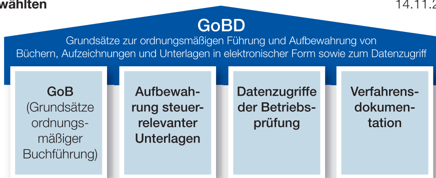
Abb. 1: Bereiche der GoBD

IV A 4 - S 0316/13/1003) einzuhalten. Nach den Grundsätzen zur ordnungsmäßigen Führung und Aufbewahrung von Büchern, Aufzeichnungen und Unterlagen in elektronischer Form sowie zum Datenzugriff (den GoBD) müssen alle elektronischen, aufbewahrungspflichtigen Geschäftsunterlagen – insbesondere steuerrelevante Daten – den Anforderungen hinsichtlich Datensicherheit, Unveränderbarkeit, Aufbewahrung und maschineller Auswertbarkeit genügen. Die GoBD lassen sich wie in Abb. 1 dargestellt struktu-