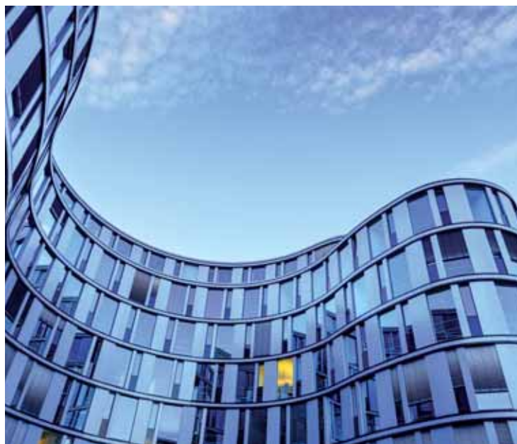
Immobilien sollen noch immobilier werden