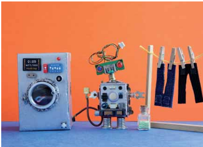
Prozesse sind zu beschreiben und zu visualisieren

Bei der Anfertigung der Prozessablaufdarstellung (Flow-Charts) werden Tools für Prozessdesign und -visualisierung (Office-Anwendungen, Prozessvisualisierungstools, Signavio, ARIS etc.) eingesetzt. Für eine prozessübergreifende Einheitlichkeit in der Darstellung empfiehlt sich die Anwendung eines Prozessvisualisierungs-Frameworks (Business Process Modelling Notation, Ereignisgesteuerte Prozessketten etc.). Wie für alle Dokumentationsunterlagen ist auch für die Prozessdokumentation sicherzustellen, dass Änderungen