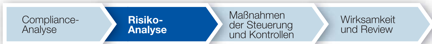
Abb. 2: Vier Phasen des PKF Tax Compliance Management Systems

Analyse ist die Prozessdokumentation einschließlich der Beschreibung des internen Kontrollsystems.