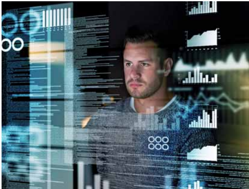
Neues Werkvertragsrecht vor allem im IT-Bereich von Bedeutung

Nach der Neuregelung tritt nun eine Abnahmefiktion ein, wenn der Bestel-