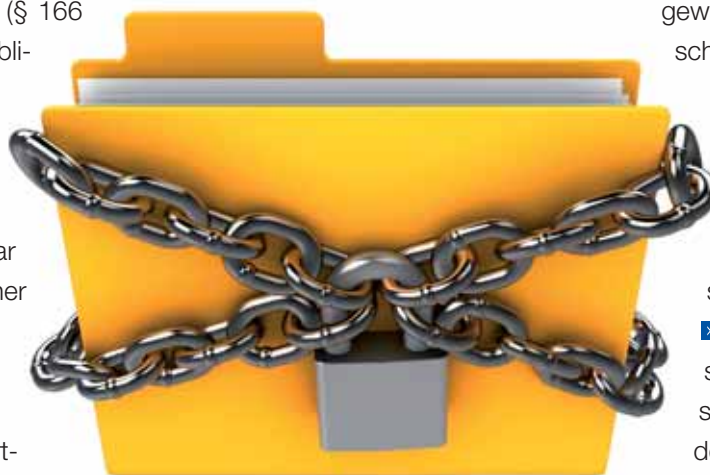
Realität: Gesellschafter ohne (Informations-)Rechte

lich wirksam abbedungen werden. Die Stellung des Kommanditisten ist grund-