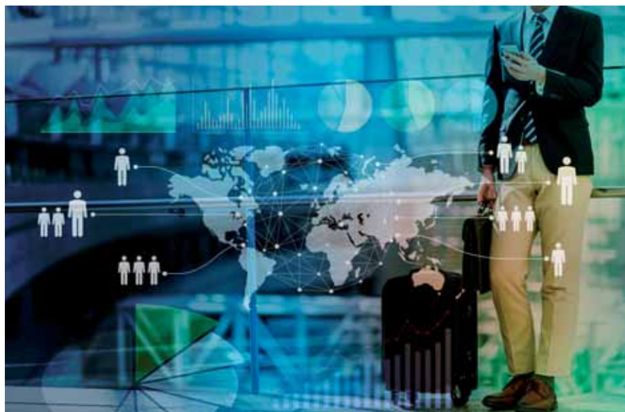
Multinationale Besteuerung von mobilen Arbeitnehmern geregelt – aber auf 100 Seiten

Während die unbeschränkte Steuerpflicht nach deutschem Einkommensteuerrecht eine umfassende Steuerpflicht begründet, führt die Ansässigkeit einer Person in einem der DBA-Vertragsstaaten (nur) dazu, dass das DBA auf sie angewendet werden kann (Abkommensberechtigung). Der andere Vertragsstaat ist dann Quellenstaat. Eine Person kann zwar in beiden Ver-