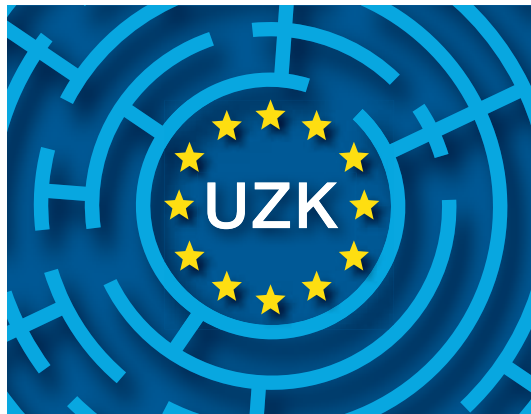
UZK erfordert Prüfung bisheriger Bewilligungen

» Mehr zum Thema: Das erwähnte BFH-Urteil vom 30.11.2016 (Az.: VIII R 11/14) ist im Internet unter www.bundesfinanzhof.de zu finden.