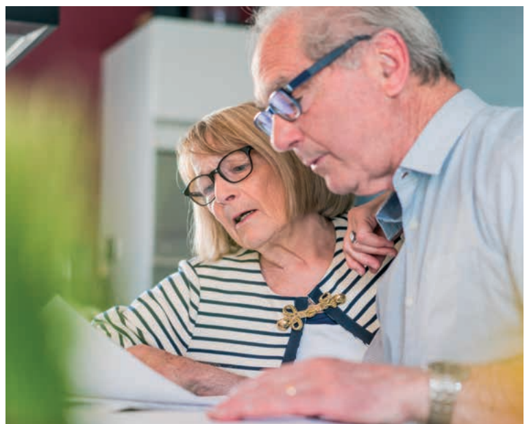
Ist Ihre Patientenverfügung noch wirksam?

» Sachverhalt: Die an bindende Patientenverfügungen geknüpften Voraussetzungen hat der BGH mit Urteil vom 8.2.2017 (Az.: XII ZB 604/15) konkretisiert: Befindet sich eine unter Betreuung stehende Person in einer Lage, in der über den Abbruch lebenserhaltender Maßnahmen nachgedacht wird, bedarf der Betreuer für diese Entscheidung grundsätzlich einer betreuungsgerichtlichen Genehmigung (§ 1904 Abs. 2 BGB). Eine solche Genehmigung ist nicht erforderlich, wenn eine bindende Patientenverfügung vorliegt. Dann ist es die Aufgabe des Betreuers, nicht eine eigene Entscheidung zu treffen, sondern dem Willen des Betroffenen Ausdruck und Geltung zu verleihen.