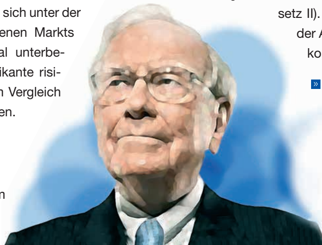
Mit Value Investing auf den Erfolgsspuren von Warren Buffett?

» Empfehlung: Kleinbetragsrechnungen sollten nur die Pflichtangaben nach § 33 UStDV enthalten, da zusätzliche Angaben das Risiko einer unvollständigen bzw. unrichtigen Rechnung in sich bergen und so den Vorsteuerabzug des Leistungsempfängers gefährden.